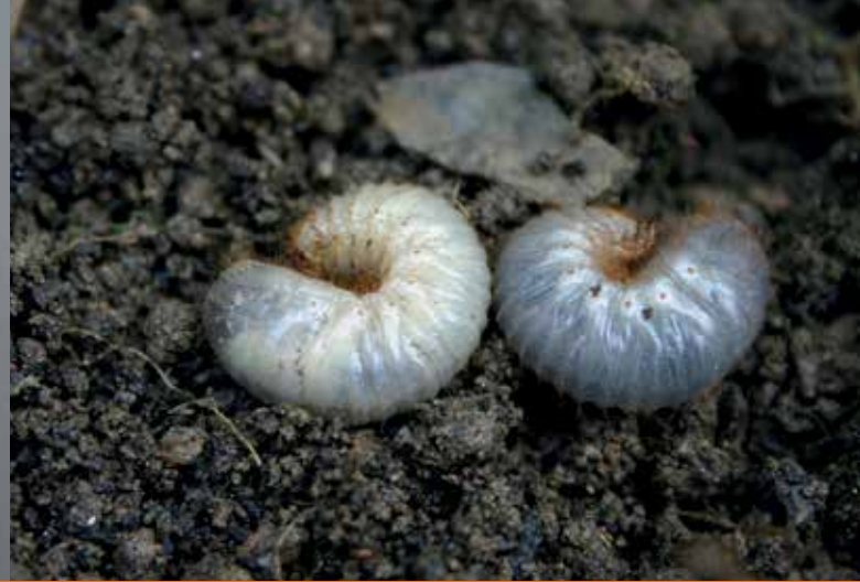
Engerlinge des Rosenkäfers

Die wenigsten Bodentierchen verursachen Probleme im Garten. Während ihrer jahrelangen Entwicklung im Boden ernähren sich manche Larven von lebenden Wurzeln und können so Pflanzen schwächen.