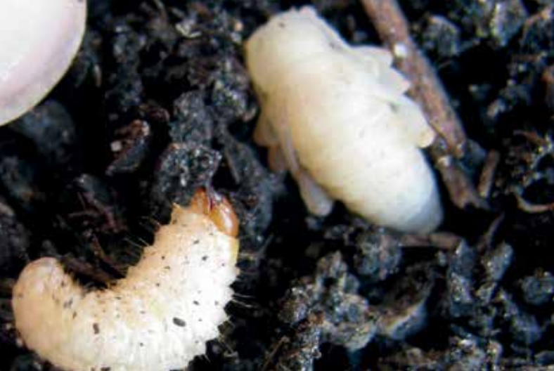
Larve und Puppe des Dickmaulrüsslers